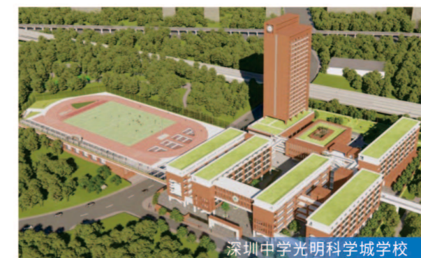
深圳中学光明科学城学校

8月26日地下室地基与主体结构、人防工程主体结构中间验收 服务模式 工程监理 项目规模 总建筑面积约9.5万平方米,总投资约6.9万元