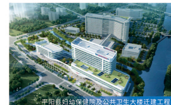
平阳县妇幼保健院及公共卫生大楼迁建工程

8月26日部分基础验收、中间结构验收 服务模式 全过程工程咨询 项目规模 总建筑面积约3.8万平方米,总投资约3.1万元