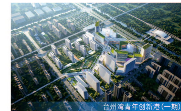
台州湾青年创新港(一期)

8月2日8#楼主体结顶;8月8日14#楼主体结顶 服务模式 工程监理 项目规模 总建筑面积约18万平方米,总投资约13.7亿元