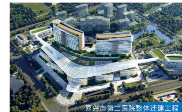
嘉兴市第二医院整体迁建工程

8月28日综合楼主体结顶 服务模式 全过程工程咨询 项目规模 总建筑面积约10.4万平方米,总投资约10亿元