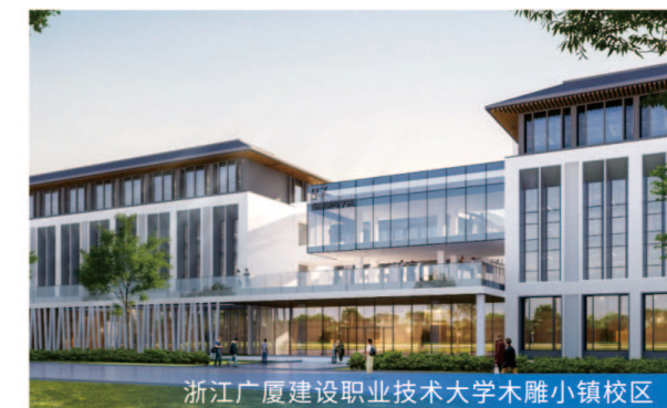
浙江广厦建设职业技术大学木雕小镇校区

8月7日B楼、A楼1-7层主体分部验收 服务模式 工程监理 项目规模 总建筑面积约8.9万平方米,总投资约6.6亿元