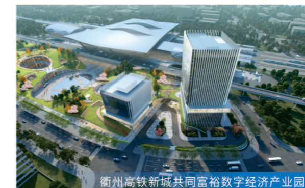
衢州高铁新城共同富裕数字经济产业园

8月2日8#楼主体结顶;8月8日14#楼主体结顶 服务模式 工程监理 项目规模 总建筑面积约18万平方米,总投资约13.7亿元