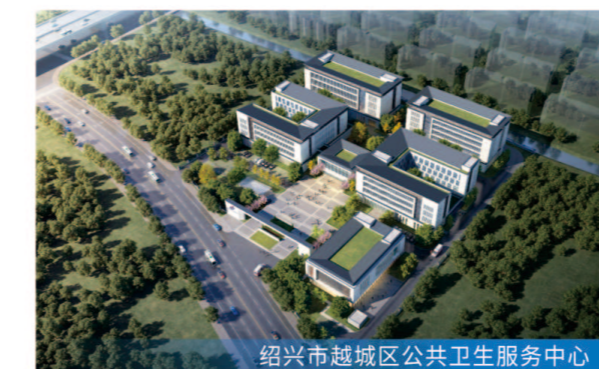
绍兴市越城区公共卫生服务中心

8月23日主塔楼封顶 服务模式 工程监理 项目规模 总建筑面积约16.5万平方米,总投资约16亿元