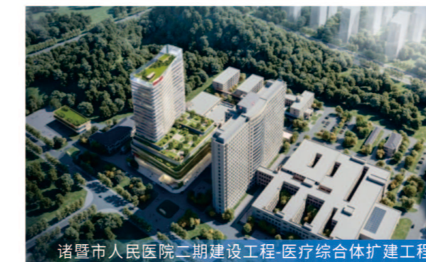
诸暨市人民医院二期建设工程-医疗综合体扩建工程

8月27日交付完成 服务模式 全过程工程咨询 项目规模 总建筑面积7.1万平方米,新增规模54个班