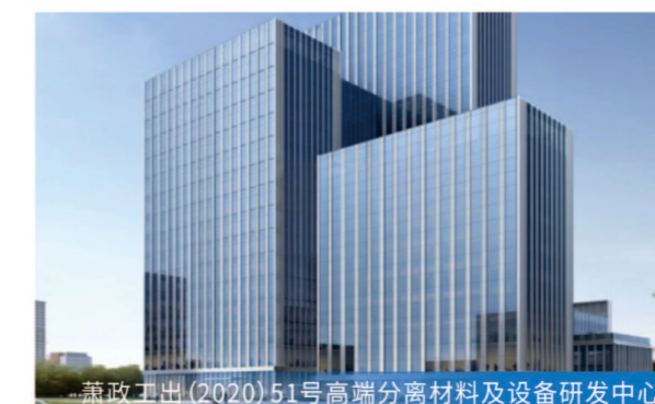
龙政五洲(Q020)51号高端分离材料及设备研发中心

8月15日基础第一块底板浇筑 服务模式 全过程工程咨询 项目规模 总建筑面积约12万平方米,总投资约18.3万元