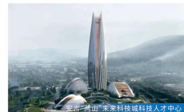
安吉“两山”未来科技城科技人才中心

8月19日主体结顶 服务模式 工程监理 项目规模 总建筑面积约6.6万平方米,总投资约3亿元