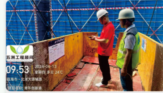
10.台州湾青年创新港 [质量安全检查]