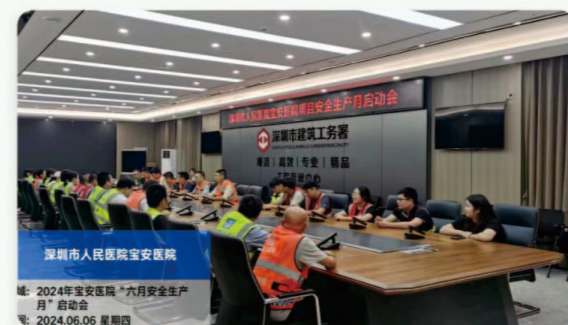
02.深圳市人民医院宝安医院 [安全生产月启动会]