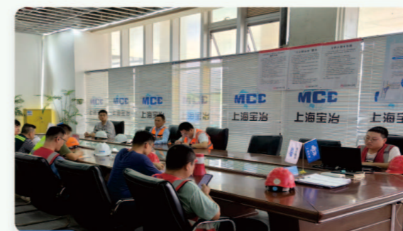
01.深圳市大鹏新区人民医院 [安全生产月启动会]

6月以来，集团各部门、各机构、各项目积极贯彻安全生产月“人人讲安全，个个会应急——畅通生命通道”活动精神，启动会、安全知识培训、应急救援演练、事故警示教育、质量安全检查等活动有序开展，有效推进“安全生产月”与集团部署的各专项工作同谋划、同部署、同检查、同落实。