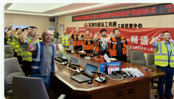
03.深圳市人民医院改扩建工程一期 [安全生产月启动会]