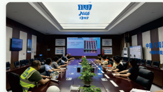
04.中国科学院大学深圳医院(光明)新院 [安全生产知识培训]