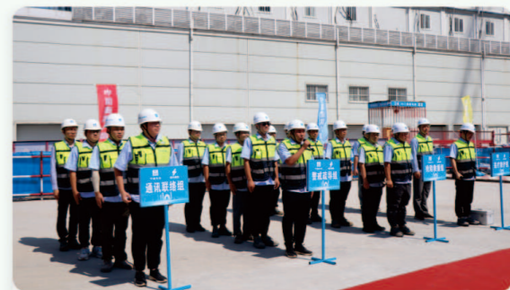
06.绍兴传媒中心 [支模架坍塌应急处置演练]