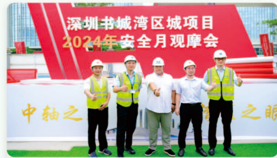
09.深圳书城湾区城 [安全生产月观摩交流会]