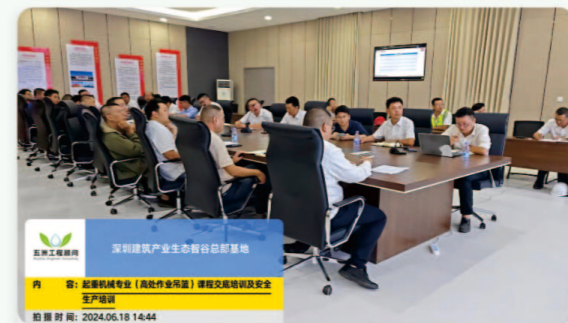
05.深圳建筑产业生态智谷总部基地 [安全生产知识培训]