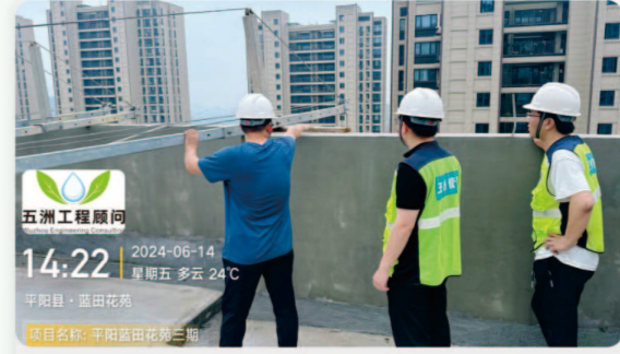
12.平阳蓝田花苑三期 [质量安全检查]