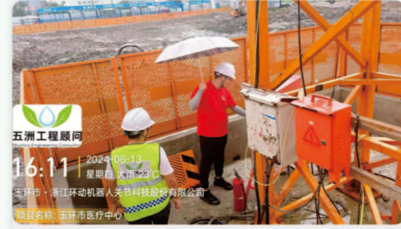
11.玉环市医疗中心 [质量安全检查]