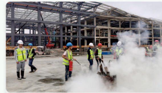
07.台州国际博览中心 [消防安全应急演练]