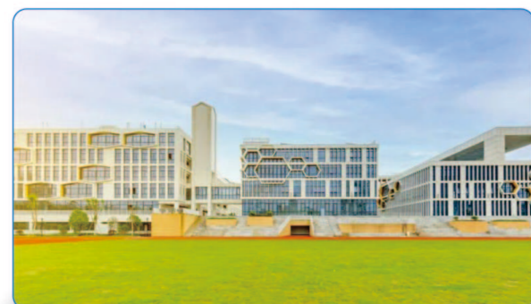
艮北新区单元九年一贯制学校 二等奖 勘察设计奖