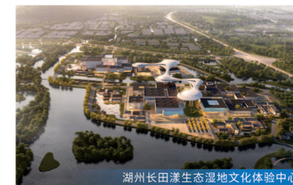
湖州长田漾生态湿地文化体验中心

项目定位 项目建成后，将进一步完善城市配套功能，优化产业结构布局，通过大力发展会展经济，进一步提升城市知名度和美誉度，对台州现代服务业高质量发展具有重要意义。