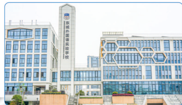
艮北新区单元九年一贯制学校 三等奖 勘察设计奖