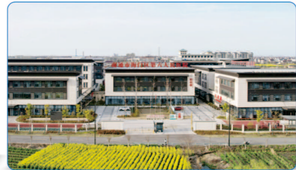
海门市仁济医院 三等奖 勘察设计奖

设计以漂浮于平台的院落为母题，采用教育建筑综合体模式，实现便捷的上下层联系。在校园空间营造上配置多类型的学习空间，满足师生合作共创学习需求。