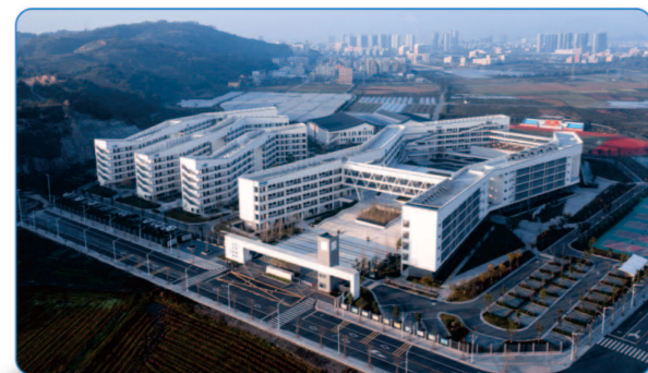
乐清市柳市中学 三等奖 勘察设计奖