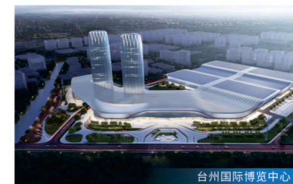
台州国际博览中心

项目定位 地铁10号线工程是连接主城区与渭北地区的轨道交通快线，对优化城市总体空间布局、实现城市“北跨”发展，推动区域融合，促进沿线产业升级具有十分重要的意义。