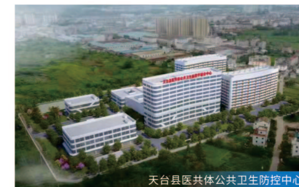
天台县医共体公共卫生防控中心

项目定位 鸿雁未来社区是全省首批24个未来社区试点创建项目之一，也是绍兴市首个试点未来社区，打造孝德为核、汇聚英才、低碳环保、空间多样、以人为本、富有活力的未来社区。