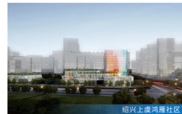
绍兴上虞鸿雁社区

项目定位 项目包括博物馆、少年宫、妇女儿童发展中心、科技馆、生态馆、商业及配套设施等。建成后将成为集研学旅游、科普教育、文化交流、商业休闲功能于一体的城市交流中心。