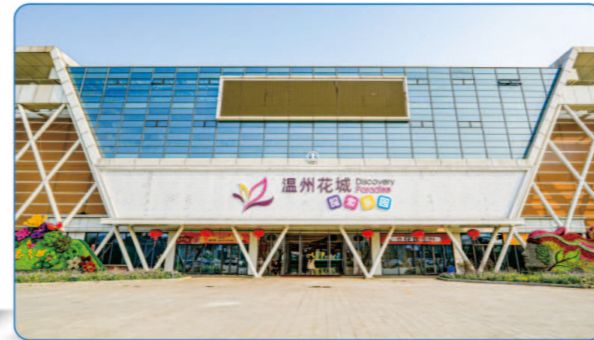
温州花城 三等奖 勘察设计奖

将各个功能块组织在一起，通过高效、便捷、宽敞、明亮的水平及竖向交通将各功能空间串联起来，创造全新的、风格优美的、舒适的、富有现代化气息的“绿色医院”。